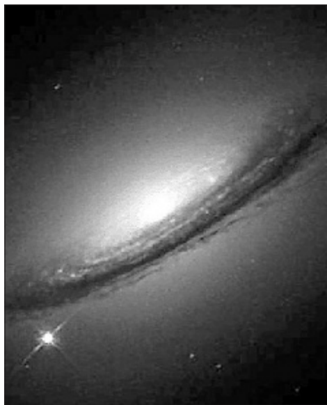
Las supernovas en galaxias lejanas dan pistas sobre la energía oscura del universo (izquierda), e imagen del cerebro en funcionamiento.